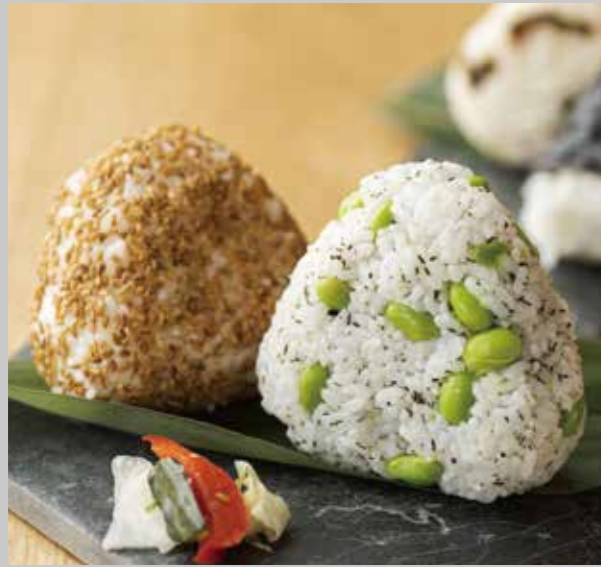
芳香金ゴマとこだわり塩おにぎり/函館ガゴメ塩と中札内産枝豆のおにぎり