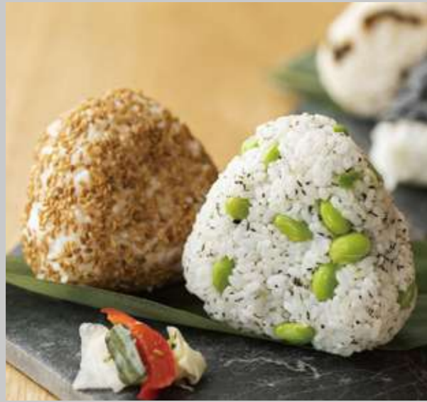
芳香金ゴマとこだわり塩おにぎり/函館ガゴメ塩と中札内産枝豆のおにぎり