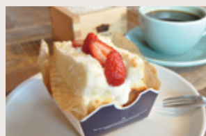
米粉シフォンフルーツサンド